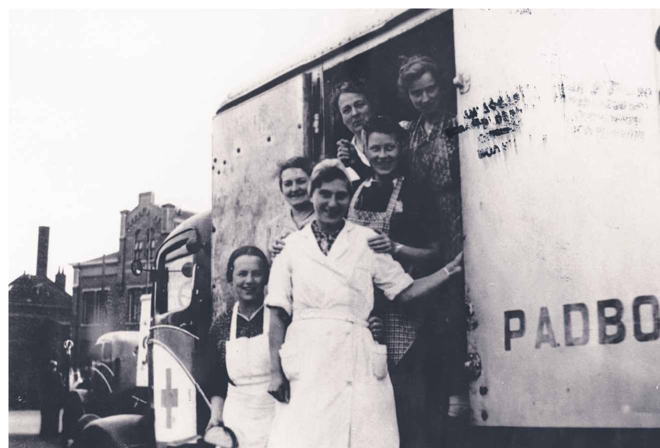
Vertrek van een konvooi uit het Deense Padborg, via Lochem en Zutphen naar Utrecht, op 27 september 1945, Bov Local Archives.