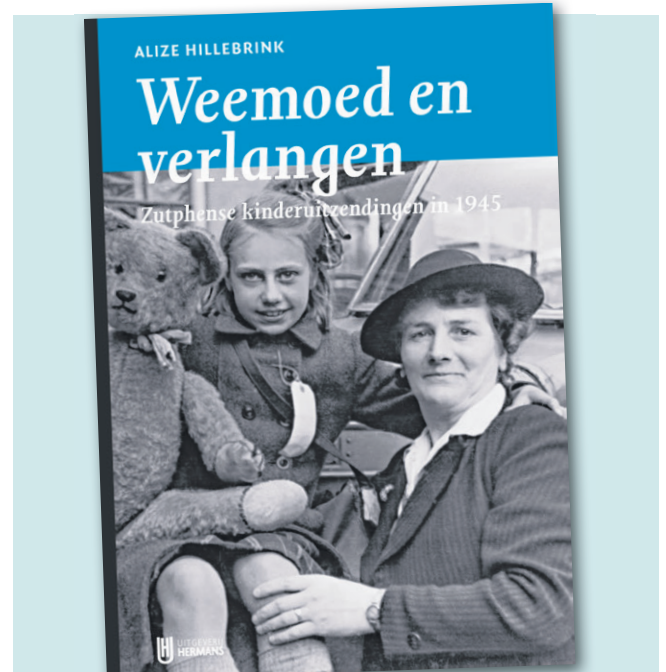
Alize Hillebrink: Weemoed en verlangen, Zutphense kinderruitzendingen in 1945 . Uitgeverij Hermans, € 14,50. Verschijnt op 18 augustus.