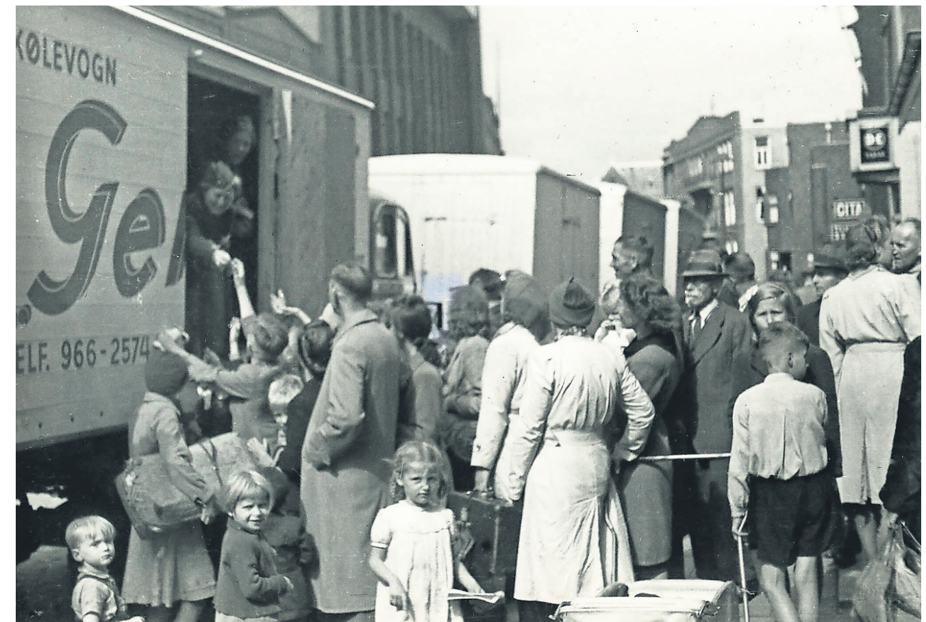
Transport met koelwagens naar Scandinavië, 1945